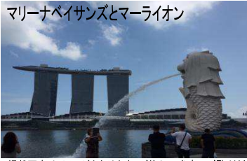
マリーナベイサンズとマライオン

●ガーデンズバイザベイスカイウェイ・マリーナベイサンズスカイパーク・クラークキーリパーククルーズ●