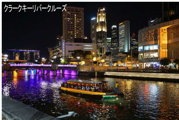
クラークキーリパーククルーズ